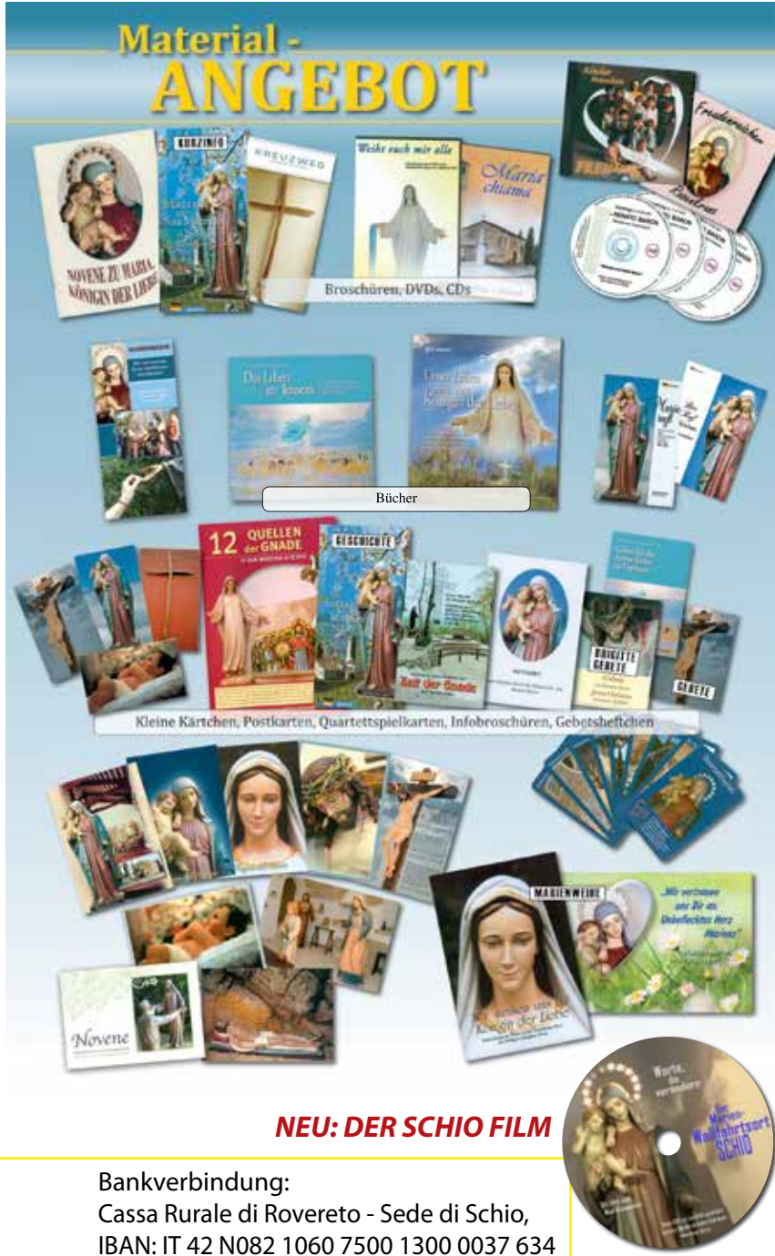
Broschüren, DVDs, CDs