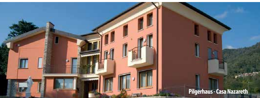
Pilgerhaus - Casa Nazareth