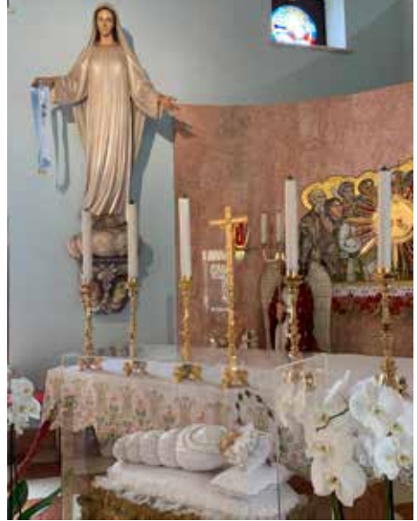
Fest Mariä Geburt

ist verpflichtet, der darf nicht ohne täglichen Rosenkranz bleiben und sühnen. Viele Verbrechen, Glaubensabfall und Sakrilegien. Auch die Pädophilie ist ein Sakrileg. Und wir könnten ein ganzes Register aufführen, aber wir haben keine Zeit. Aber in erster Linie wollen wir sühnen. Und wir wollen das in erster Linie tun mit einem kohärenten Leben und eben mit dem Gebet und mit dem Opfer. Danken wir also dem Herrn, dass er zugelassen hat, dass Maria in unsere Zeit kommen darf. Und so danken wir für alle Gnaden, die Maria heute an ihrem Fest austeilen möchte. Gelobt sei Jesus Christus.