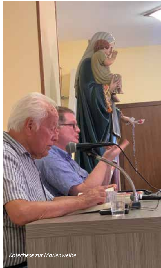
Katechese zur Marienweihe

Also der Mensch, der sich dem unbefleckten Herzen Mariens geweiht hat, hat diese große Aufgabe in unserer Zeit. Das Gebet, um dem Feind viele Seelen aus der Hand zu reißen. Also einer, der sich dem unbefleckten Herzens Mariens geweiht hat, der