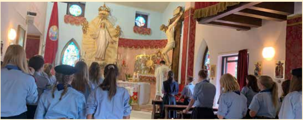
Eine Mädchen - Pfadfindergruppe aus Deutschland machte auf ihrem Sommerlager halt in Schio bei der Königin der Liebe.