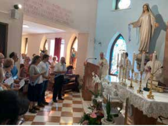
Erstweihe im Cenacolo

wer in schwerer Sünde die Kommunion empfängt, der schadet nicht nur sich selber, sondern der ganzen Kirche selbst.