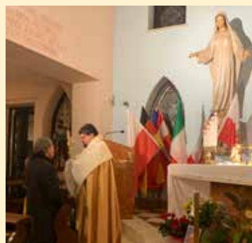
Zum Konvent im Oktober trafen sich Mitarbeiter aus den Ländern der Schweiz, Österreich, Südtirol und Deutschland ein. Unter dem Thema: „Maria, die sichere Hoffnung auf unserem Glaubensweg!“ haben sich viele Mitarbeiter wieder NEU senden lassen, um im Werk der Liebe tatkräftig mit ihren Charismen mitzuwirken.