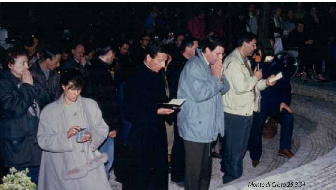
Monte di Cristo 25.3.94