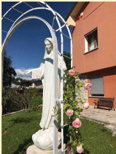
Statue der Königin der Liebe vor dem Pilgerhaus Casa Nazareth