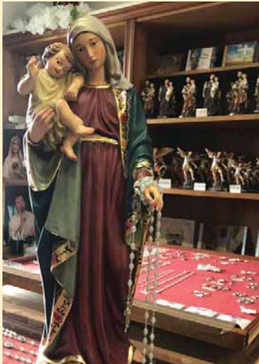
▲ Viele Statuen der Königin der Liebe verließen den Laden und ziehen nun als Wandermuttergottes von Haus zu Haus.