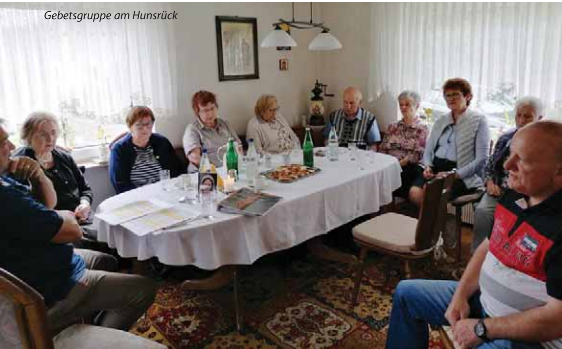
Gebetsgruppe am Hunsrück