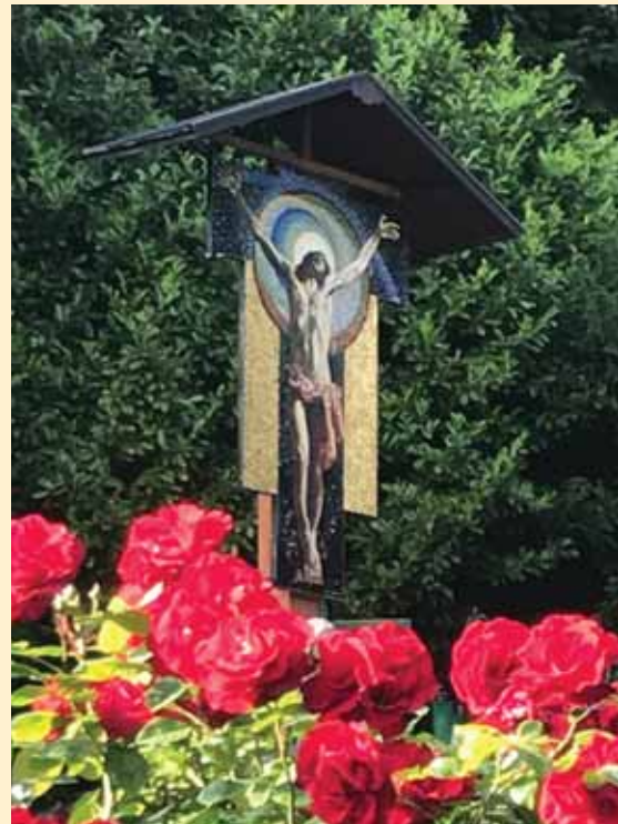
▲ Mosaikkreuz im Park des Cenacolo inmitten der Rosenblüten