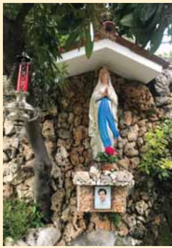
▲ Die Lourdesstatue im Garten von Rita Baron neu bemalt