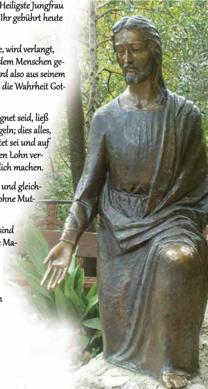
Bronzestatue auf dem Monte di Cristo

Lasst euch von Ihr vollkommen mitreißen, und auch ihr werdet groß werden und Ich werde euch in Ewigkeit segnen.“ 15/8/92