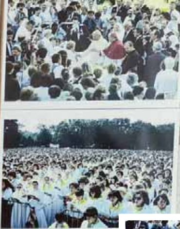
Fotos vom Pastoralbesuch von Papst Johannes Paul II in Vicenza, am 8. September 1991.

Die Bilder sind ausgestellt in der „Casa del Pellegrino“ in Monte Berico