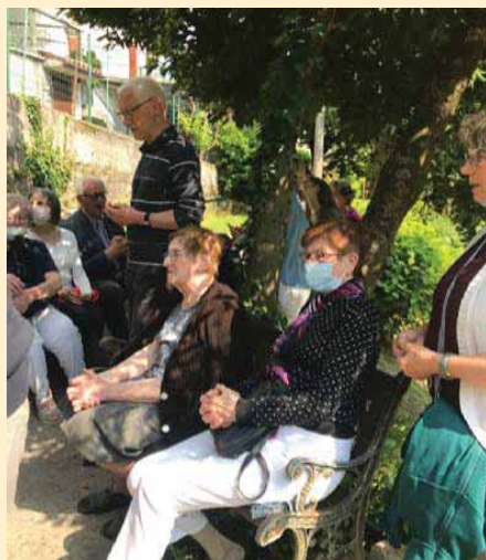
Rita im Gespräch und im gemeinsamen Gebet mit den Pilgern