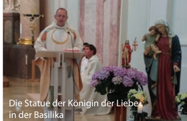
Die Statue der Königin der Liebe in der Basilika

Am Samstag, den 09.11.2019 findet das nächste Treffen in Pöllau bei Hartberg - Steiermark, von 13:30 – 20:00 Uhr statt. Nähere Informationen zu den Programmpunkten folgen (siehe auch nebenstehende Übersicht) □