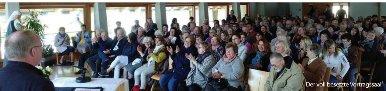
Der voll besetzte Vortragssaal